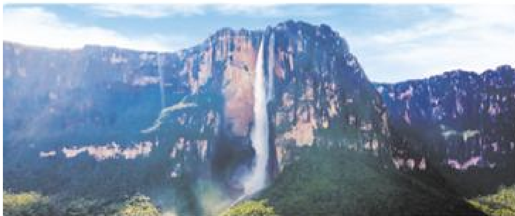
El Salto del Ángel, en Venezuela, es uno de los paisajes más conocidos de América del Sur.