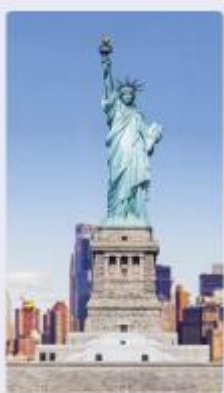
Nueva York es la ciudad más poblada de Estados Unidos. Tiene cerca de 8,3 millones de habitantes.

Conocer la densidad de población de un lugar es útil para planear la disponibilidad de servicios. Por ejemplo, un área densamente poblada requiere servicios de transporte variados y eficientes, una oferta adecuada de atención médica, así como disponibilidad de viviendas y centros educativos.