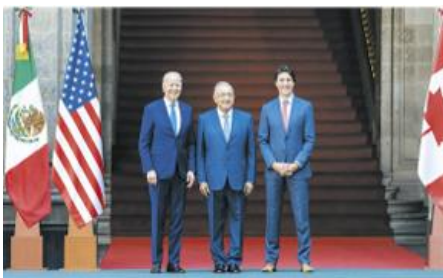
Justin Trudeau, primer ministro de Canadá; Joe Biden, presidente de Estados Unidos y Andrés Manuel López Obrador, presidente de los Estados Unidos Mexicanos.

México es una república federal presidencialista . El territorio está integrado por 32 estados. El presidente de la república es la figura representativa y ejecutiva del país.