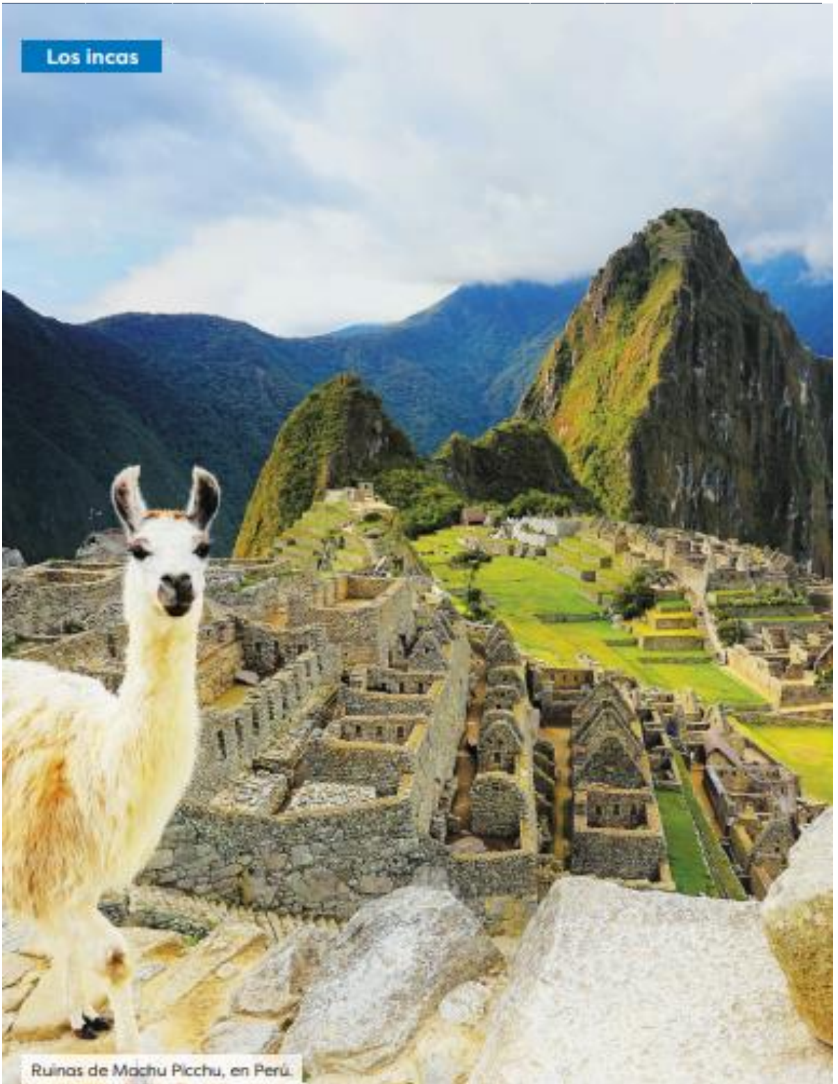
Ruinas de Machu Picchu, en Perú.