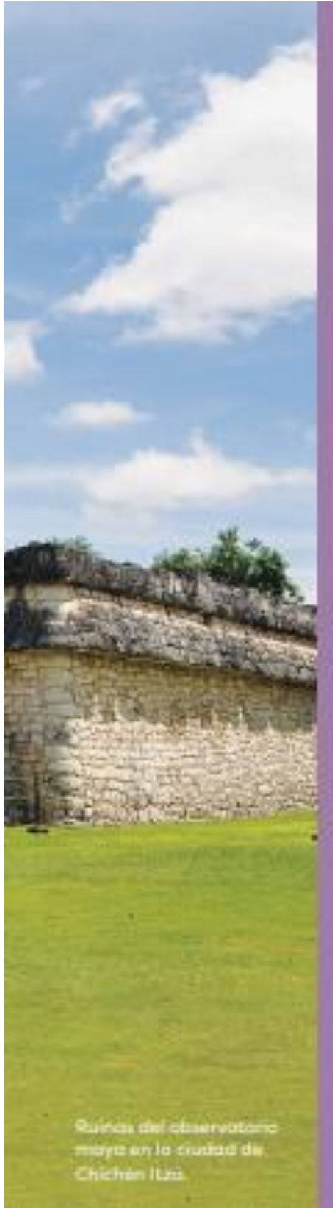
Ruinas del observatorio maya en la ciudad de Chichén Itzá.