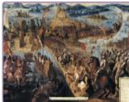
Conquista de la ciudad de Tenochtitlán