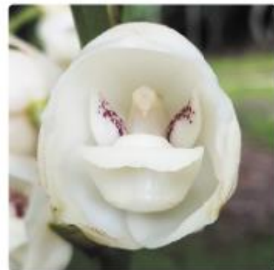
Flor del Espíritu Santo.