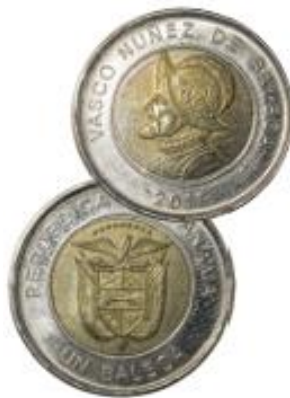
Moneda de un balboa.

La flor crece de manera natural en los bosques húmedos del país. En ocasiones crece sobre la tierra, pero también crece adherida a los troncos de árboles. Además de Panamá, se encuentra en Colombia y en Ecuador.