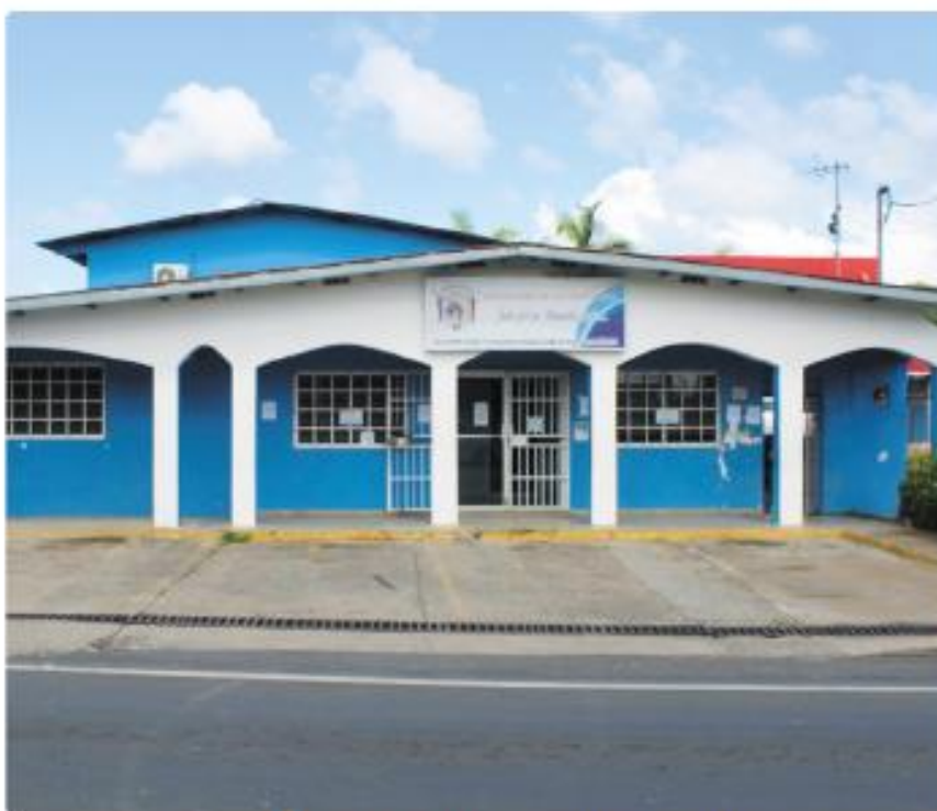
Junta Comunal de Las Mañanitas, distrito de Panamá, provincia de Panamá.