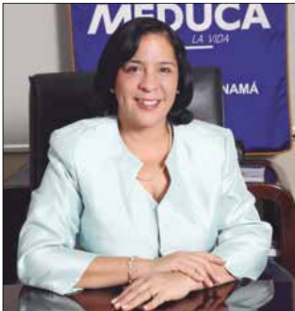
S. E. Marcela Paredes de Vásquez Ministra de Educación

“ Si comprendes, asimilas; si asimilas, razones; si razones, analizas; si analizas, descubres, si descubres, indagas; si indagas convives y si convives aprendes al máximo y creces como persona”.