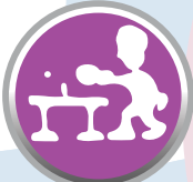
TENIS DE MESA