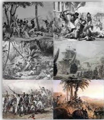
Guerras revolucionarias francesas y las guerras napoleónicas