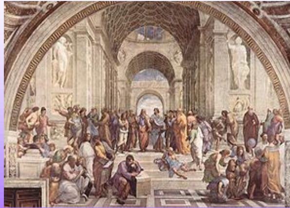
Escuela de Atenas , Fresco de Rafael

-En las artes se valora la actividad intelectual y analítica de conocimiento.