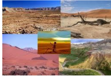
muerte de la flora y fauna