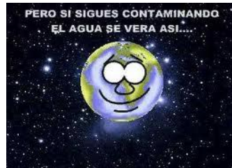
Se acaba el agua.